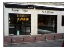
Aux 3 petits choux