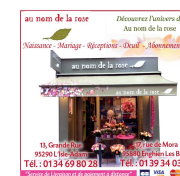
Au nom de la rose