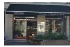
Boulangerie Le Hec'h