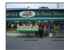
Les primeurs adamois