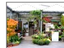
Les serres de l'Isle Adam